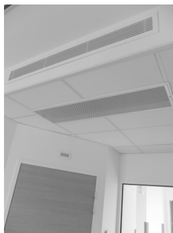
Deckeninduktionsgeräte von TROX bieten hohen Komfort durch niedrige Luftgeschwindigkeiten im Aufenthaltsbereich.