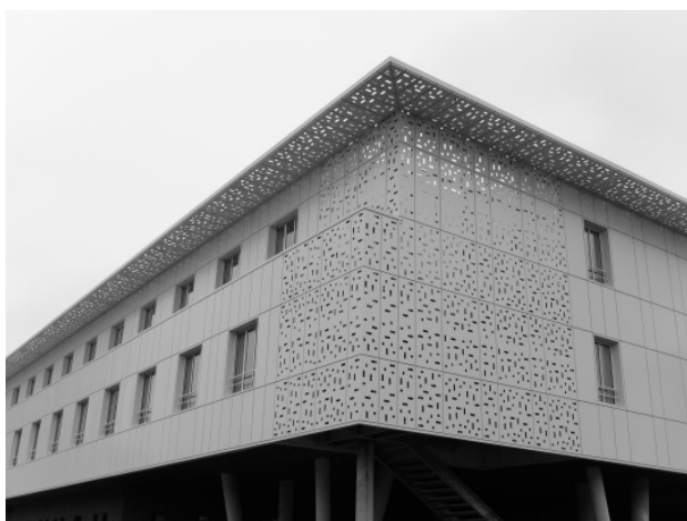
Das neue Gebäude in der Außenansicht.

Die Klimalösung mit dem Deckeninduktionsdurchlass TROX DID-E in den Zimmern und DID632 in den Gemeinschaftsbereichen erfüllt dank der großen Induktionsfähigkeit die allgemeinen Energiekriterien des Gebäudes. Die Deckeninduktionsdurchlässe DID-E sind ab Werk mit einem kompletten Abluftsystem (Anschlüsse, abnehmbares Gitter) versehen, um die Planungsanforderungen der Baustelle zu erfüllen. Nichts wird dem Zufall überlassen: Die VFL-Regler reduzieren ab einem Druck von 30 Pa den Betriebsdruck der Anlagen und sorgen so für noch größere Kosteneinsparungen.